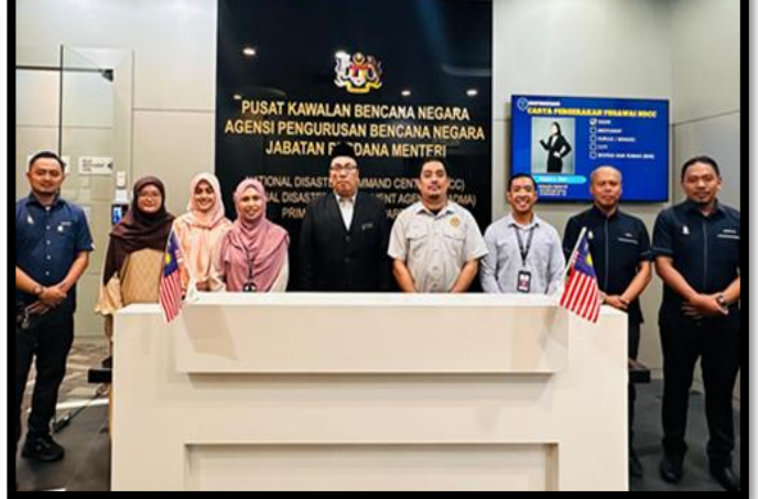
SESI TAKLIMAT DAN LAWATAN PENANDA ARAS DARI PEJABAT SETIAUSAHA KERAJAAN (SUK) NEGERI PULAU PINANG

PUSAT KAWALAN BENCANA NEGARA (NDCC) | 17 APRIL 2026