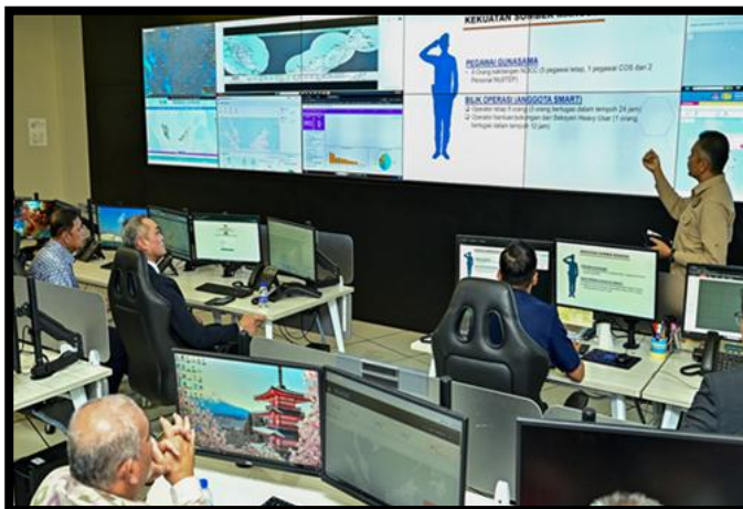
LAWATAN MENTERI HAL EHWAL DALAM NEGERI BRUNEI DARUSSALAM KE MALAYSIA

PUSAT KAWALAN BENCANA NEGARA (NDCC) | 8 APRIL 2026