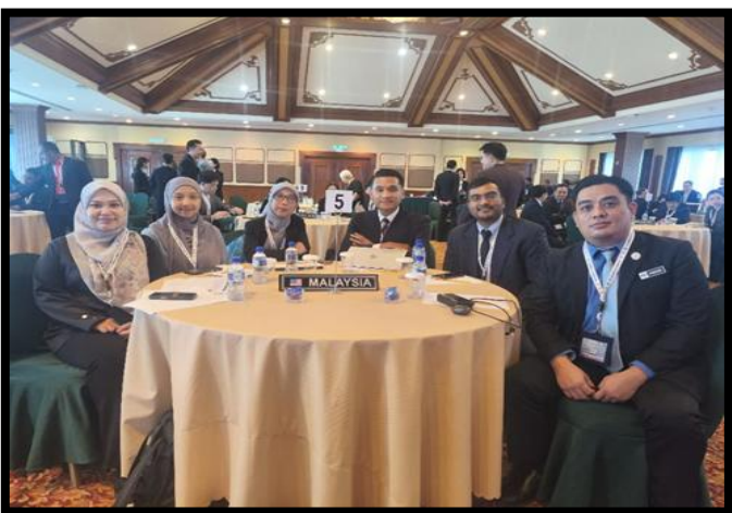
ASEAN CROSS-SECTORAL WORKSHOP ON ENHANCING WEATHER & CLIMATE INFORMATION FOR DISASTER MANAGEMENT AND 6TH AIM-NET MEETING AND WORKSHOP

PUSAT KAWALAN BENCANA NEGARA (NDCC) | 1 APRIL 2026