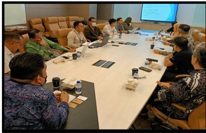
SESI PEMBENTANGAN TEKNOLOGI SATELIT UNTUK PENCEGAHAN BENCANA DARI SC SUSTAINABLE SDN BHD

PUSAT KAWALAN BENCANA NEGARA (NDCC) | 17 APRIL 2026