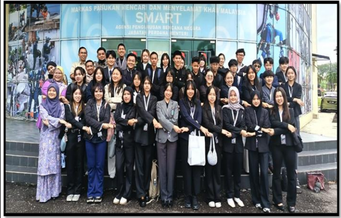
LAWATAN JAPAN AND ASEAN YOUTH SUMMIT

VANG VIENG, LAOS | 31 MAC - 1 APRIL 2026