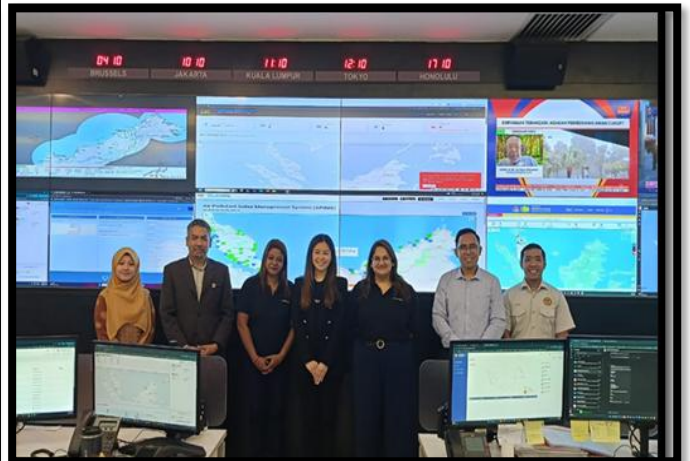
SESI TAKLIMAT DAN LAWATAN DARIPADA SPEEDOC MALAYSIA

PUSAT KAWALAN BENCANA NEGARA (NDCC) | 9 APRIL 2026