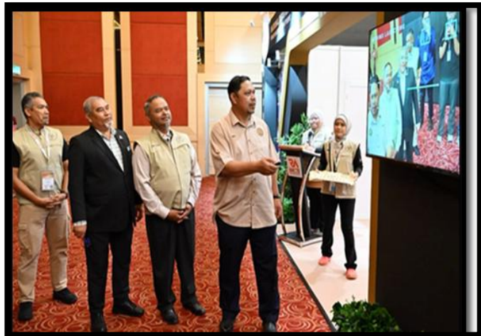
PELANCARAN APLIKASI MALAYSIA DISASTER INFORMATION MANAGEMENT SYSTEM (MYDIMS) DI RESILIENT ASIA FORUM & EXPOSITION 2026

PUSAT KAWALAN BENCANA NEGARA (NDCC) | 22 APRIL 2026