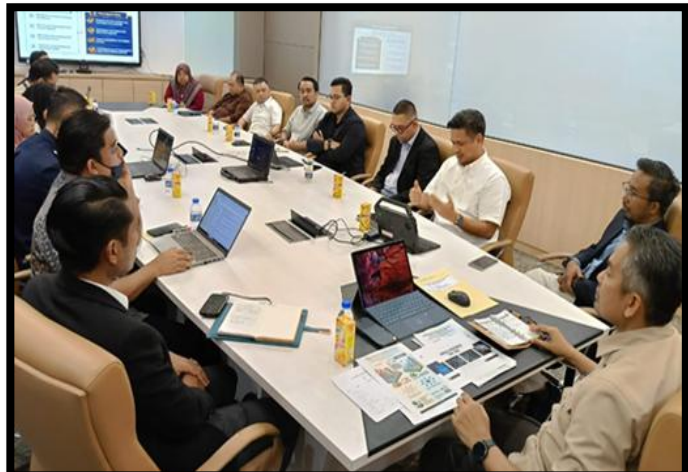
SESI PEMBENTANGAN SISTEM INTELK AMARAN DAN GERAK AWAL (SIAGA) BERASASKAN ARTIFICIAL INTELLIGENCE (AI) OLEH ARBAA PARTNERS

WORLD TRADE CENTRE (WTC), KUALA LUMPUR | 23-26 APRIL 2026