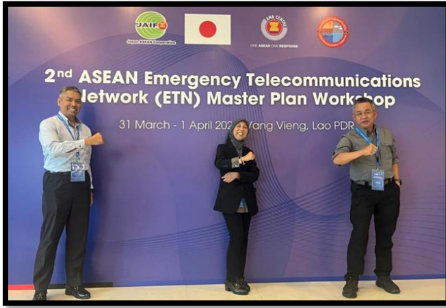
2nd ASEAN EMERGENCY TELECOMMUNICATIONS NETWORK (ETN) MASTER PLAN WORKSHOP & 4th ICT ADVISORY GROUP MEETING

VANG VIENG, LAOS | 31 MAC - 1 APRIL 2026