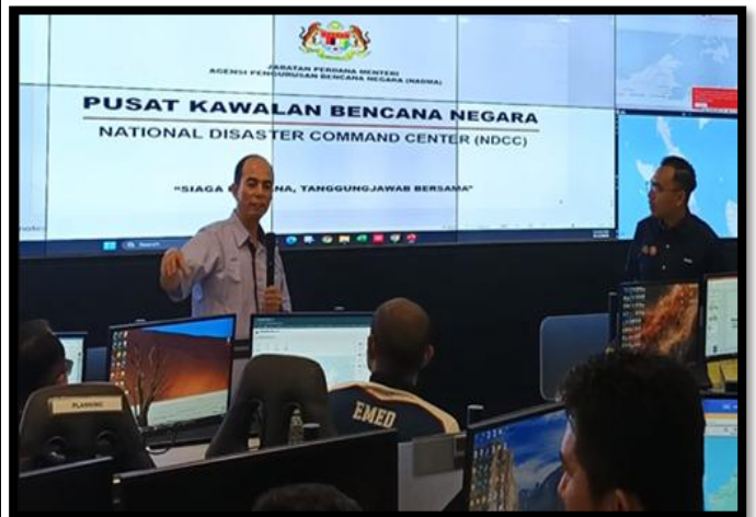
LAWATAN AKADEMIK DARI UNIVERSITI KEBANGSAAN MALAYSIA

BANDAR SERI BEGAWAN, BRUNEI DARUSSALAM | 6 - 9 APRIL 2026